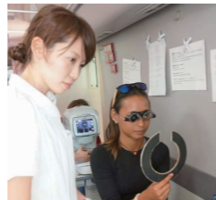
↑ ビジョンバン内での視力検査