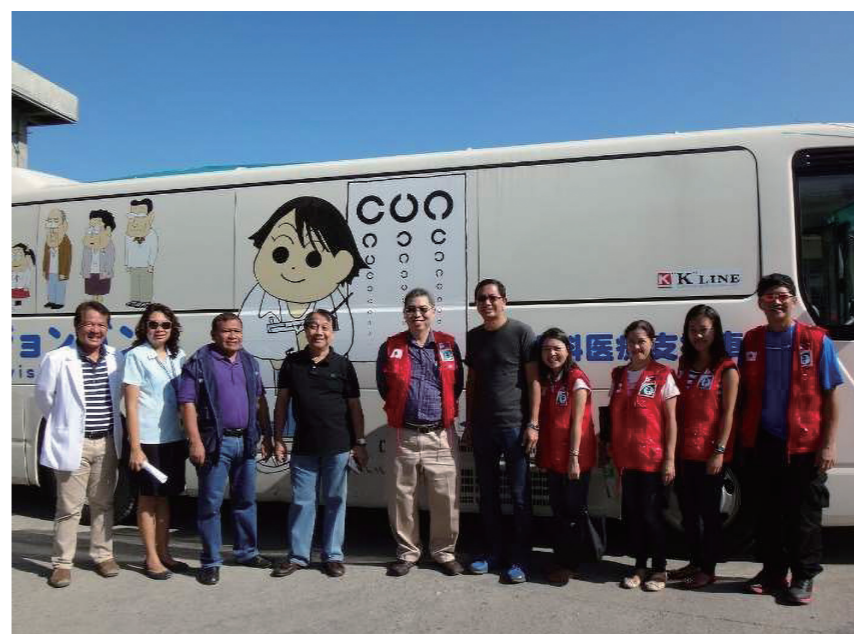
↑ ビジョンバン健診に参加した現地スタッフ