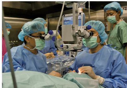
→ 「しもきた」内の手術室での手術