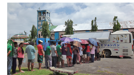
↑ ビジョンバン健診にできた炎天下の長い行列