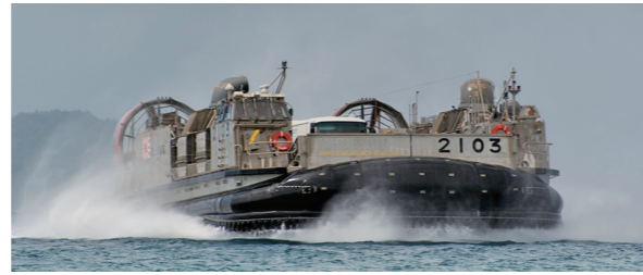
↑ 輸送艦「しもきた」から大型ホバークラフトで揚陸場に輸送されるビジョンバン

アメリカ海軍を主体とする艦艇が太平洋地域内の各国を訪問し、医療活動・文化交流を行うパシフィックパートナーシップという活動が2007年から行われており、2016年には日本の防衛省・自衛隊が担当することとなりました。それに合わせてビジョンバンは、海上自衛隊の輸送艦「しもきた」でパラオ共和国に向かい、760名に眼科医療を届けることができました。また、「しもきた」の手術室では38名の方に、白内障・翼状片等の手術を行いました。