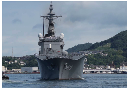
← 海上自衛隊輸送艦「しもきた」