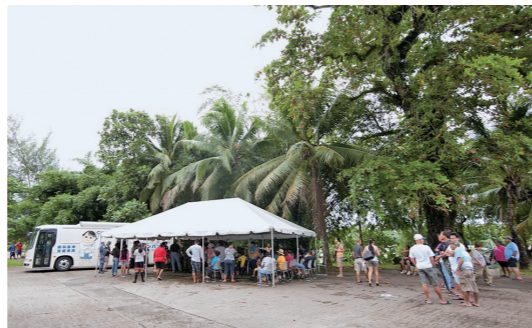
→ 希望者が殺到したビジョンバン健診