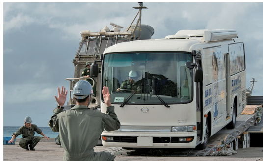
← 海上自衛隊により慎重に揚陸されるビジョンバン